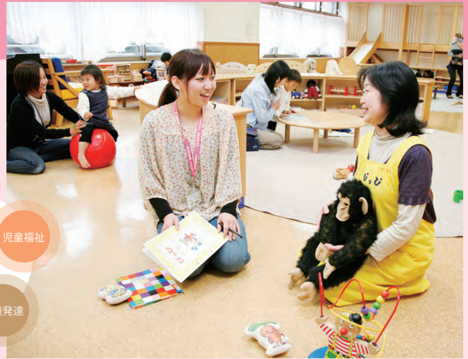
キャンパス内の子育て支援センター「びっぴ」での実習