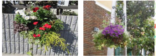
ハンギングバスケット