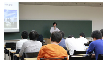
2018年度特別講義の様子